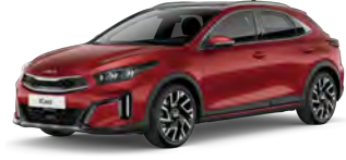
Červená Infra (AA9)