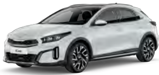
Bílá Cassa (WD)