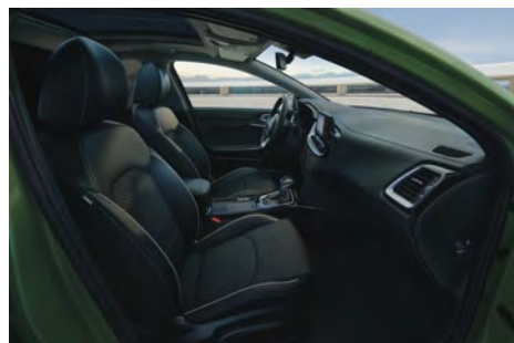
Čalounění v kombinaci látka/umělá kůže - standard pro Exclusive a TOP