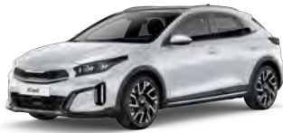
Perleťová Bílá Deluxe (HW2)