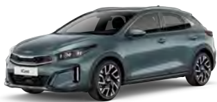
Šedá Yucca Steel (USG) - není dostupná pro GT-Line