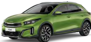
Zelená Celadon Spirit (CE6)