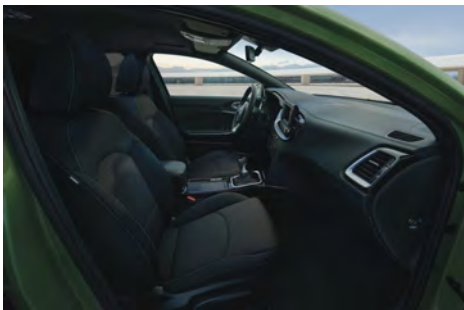
Látkové čalounění - standard pro Comfort