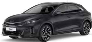
Šedá Penta Metal (H8G)