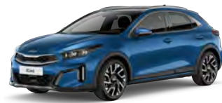
Modrá Flame (B3L)