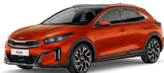
Oranžová Fusion (RNG) - není dostupná pro GT-Line