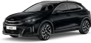
Perleťová Černá (1K)