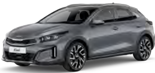
Stříbrná Lunar (CSS)