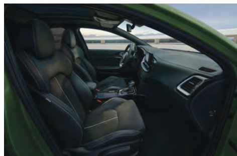
Semišové kožené čalounění - Paket Leather GTL pro GT-Line